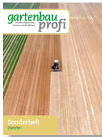
Sonderheft Zwiebel I + II