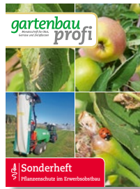
Sonderheft Pflanzenschutz im Obstbau