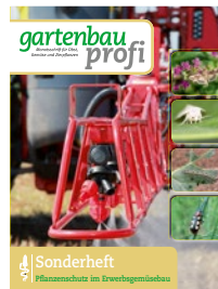
Sonderheft Pflanzenschutz im Erwerbsgemüsebau