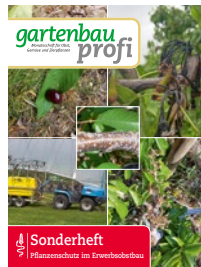
Sonderheft Pflanzenschutz im Erwerbsobstbau