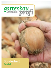
Sonderheft Zwiebel I + II